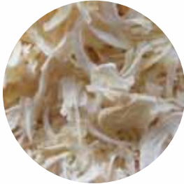
Пластівці Розмір: 8-20 мм Вологість: 6-7% Чистота: 99,9%