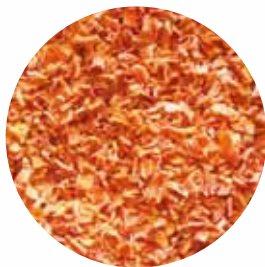
Гранули Розмір: 0,5-3 мм 2-4 мм Вологість: 4-7% Чистота: 99,9 %