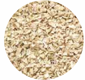
Гранули Розмір: 0,5-3 мм 2-4 мм Вологість: 4-7% Чистота: 99,9 %