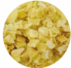
Кубики Розмір: 3*3*3 мм 5*5*5 мм 10*10*10 мм Вологість: 4-7% Чистота: 99,9 %