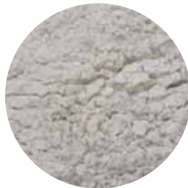
Мелена Розмір: 80-120 mesh Вологість: 4-5% Чистота: 99,9 %