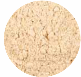
Мелені Розмір: 80-120 mesh Вологість: 4-7% Чистота: 99,9 %