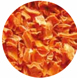
Пластівці Розмір: 4-12 мм Вологість: 4-7% Чистота: 99,9 %