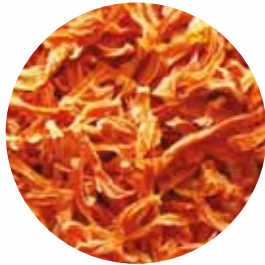
Соломка Розмір: 3*3*30 мм Вологість: 4-7% Чистота: 99,9 %