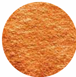
Мелена Розмір: 80-120 mesh Вологість: 4-7% Чистота: 99,9 %