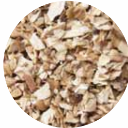
Гранули Розмір: 2-4 мм Вологість: 4-7% Чистота: 99,9 %