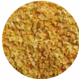
Пластівці Розмір: 4-12 мм Вологість: 4-7% Чистота: 99,9 %