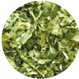
Петрушка подрібнена Розмір: 4-20 мм Вологість: 4-8% Чистота: 99,9 %