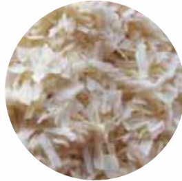
Шматочки Розмір: 3-5 мм 5-8 мм Вологість: 4-5% Чистота: 99,9 %