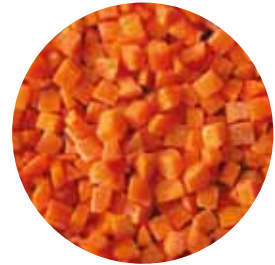
Кубики Розмір: 3*3*3мм 5*5*5 мм 10*10*10 мм Вологість: 4-7% Чистота: 99,9 %