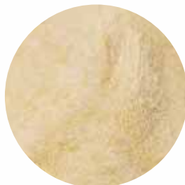
Мелена Розмір: 80-120 mesh Вологість: 4-7% Чистота: 99,9 %