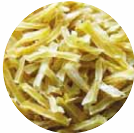
Соломка Розмір: 3*3*30 мм Вологість: 4-7% Чистота: 99,9 %