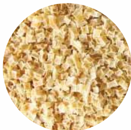
Гранули Розмір: 0,5-3 мм 2-4 мм Вологість: 4-7% Чистота: 99,9 %