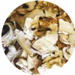
Пластівці Розмір: 4-20 мм Вологість: 4-7% Чистота: 99,9 %