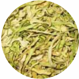
Соломка Розмір: 3*30 мм Вологість: 4-7% Чистота: 99,9 %