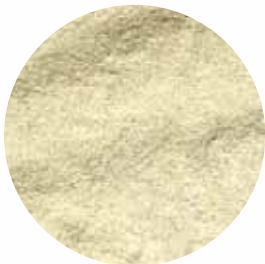
Мелена Розмір: 80-120 mesh Вологість: 4-7% Чистота: 99,9 %