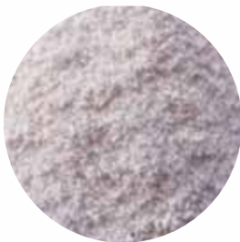
Гранули Розмір: 0.2-1 мм Вологість: 4-5% Чистота: 99,9 %