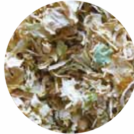
Пластівці Розмір: 4-20 мм Вологість: 4-7% Чистота: 99,9 %