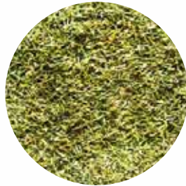
Кріп подрібнений Розмір: 4-20 мм Вологість: 4-8% Чистота: 99,9 %