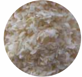
Шматочки дрібні Розмір: 1-3 мм Вологість: 4-5% Чистота: 99,9 %